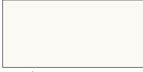
3028 İnci Beyaz/Pearl White