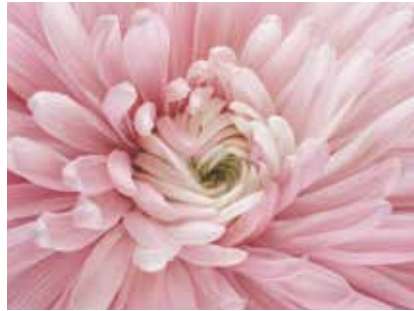
3016 Supramat Pembe Papatya/Pink Daisy