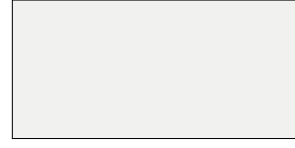
3018 Ay Işığı/Moonlight